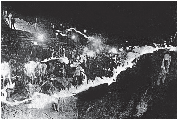
Thanh niên xung phong đào kênh ban đêm, gọi là tuyến kênh lửa. Ảnh tư liệu.