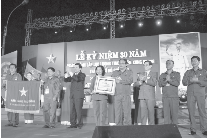
Đồng chí Trương Tấn Sang trao danh hiệu Anh hùng Lao động lần thứ hai (thứ 6 từ phải qua) cho Lực lượng Thanh niên xung phong Thành phố Hồ Chí Minh, năm 2006.