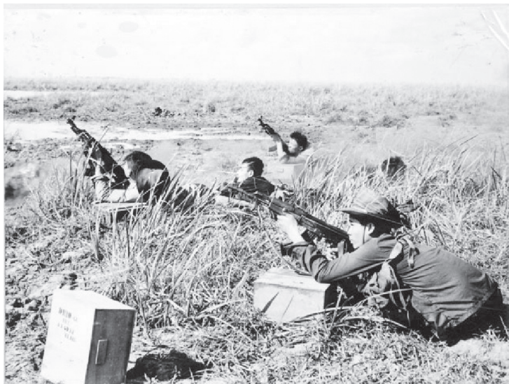
Thanh niên xung phong tham gia đánh địch.