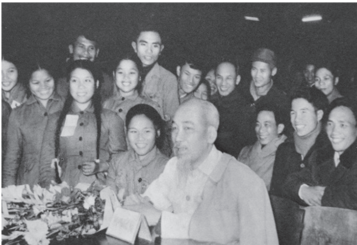
Bác Hồ với Thanh niên xung phong chống Mỹ cứu nước, năm 1967.

tóe, khói bay mù mịt bao trùm trọng điểm. Tốp Thanh niên xung phong đi sau thấy thế gào thét, lao về hiện trường. Cán bộ, nhân dân, nơi Tiểu đội nữ Thanh niên xung phong đóng quân gần đó cũng lao ra. Nhưng đến nơi, mọi người chỉ còn thấy những hố bom sâu hoắm, cuốc xẻng, quần áo bắn tung tóe... Cả 10 cô gái Thanh niên xung phong Tiểu đội 4 đã hy sinh. Sự hy sinh cao cả của các cô gái Thanh niên xung phong thể hiện tinh thần “sống bám đường, chết kiên cường, dũng cảm”. Ngưỡng mộ sự hy sinh quên mình vì sự nghiệp cao cả và ghi nhận những cống hiến vẻ vang của 10 cô gái Thanh niên xung phong tại Ngã ba Đồng Lộc, ngày 07/6/1972, Nhà nước đã truy tặng 10 nữ liệt sĩ Thanh