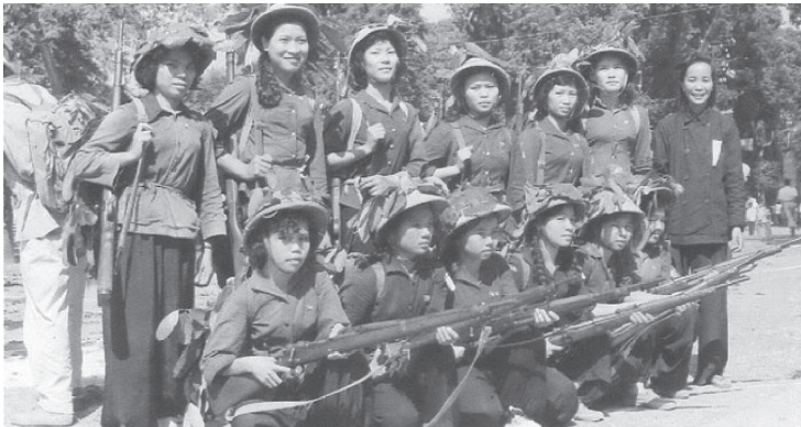
Nữ Thanh niên xung phong tập quân sự.

chiến lược với tổng chiều dài 4.130km. Trong đó có những con đường quan trọng, như: đường 20 - Quyết thắng; đường 21, 21B, 22B Hà Tĩnh; đường 10 từ Quảng Bình đi biên giới Việt - Lào; đường số 12, 16 và 18 ở Quảng Bình...;