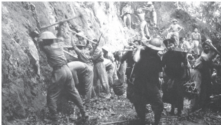
Bộ đội và Thanh niên xung phong mở đường Tuân Giáo - Điện Biên Phủ. Ảnh tư liệu.

phong Trung ương được giao nhiệm vụ phá thác ghềnh trên sông Đà, sông Mã, sông Nậm Na để vận tải bằng đường thủy. 40 đại đội với 14.000 người của Đội 34 và 40 được bố trí từ Tạ Khoa, Nghĩa Lộ đến đèo Chẹn, từ Cò Nòi đến Pha Đin, Tuân Giáo vào Điện Biên.