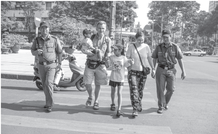
Thanh niên xung phong tham gia bảo vệ khách du lịch.

giữ xe 2 bánh và 4 bánh đúng giá quy định, đầu tư xây dựng và quản lý nhà vệ sinh công cộng, xây dựng công trình tiện ích công cộng và phúc lợi xã hội, cung cấp nước sạch, giữ gìn trật tự giao thông đường bộ, vận chuyển khách trên sông. Giai đoạn 2005-2010, Công ty được bổ sung nhiệm vụ bảo vệ khách du lịch (3/2006); tiếp nhận các công ty: Công ty Đầu tư và Xây dựng Thanh niên xung phong, Công ty Sản xuất kinh doanh thương mại và Dịch vụ xuất nhập khẩu Thanh niên xung phong, Công ty Khai thác Chế biến lâm nông sản cung ứng xuất khẩu (4/2009); tiếp nhận nhiệm vụ quản lý và bảo vệ rừng phòng hộ Cần Giờ từ Tổng đội 1 Thanh niên xung phong (01/2010). Theo Quyết định số 1579/QĐ-UBND ngày 07/4/2010 của Ủy ban nhân dân Thành phố Hồ Chí Minh, Công