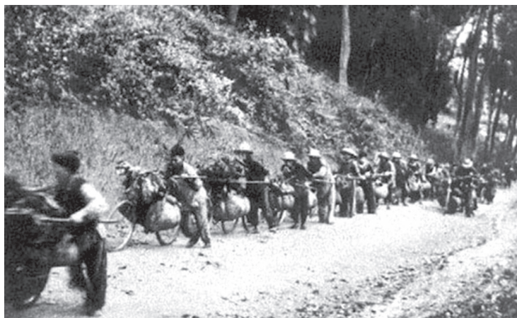
Xe thổ lên Điện Biên. Ảnh tư liệu.

“Kết thúc chiến dịch, 16.000 Thanh niên xung phong đã giữ vững được 3.300km đường, phá hàng nghìn bom nổ chậm, đảm bảo giao thông ở 60 bến