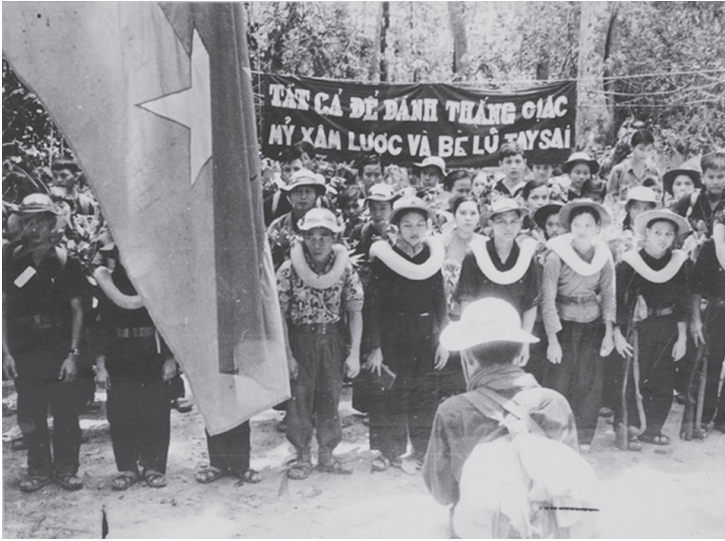
Đội 198 Thành Đồng của Sài Gòn - Gia Định. Ảnh tư liệu.