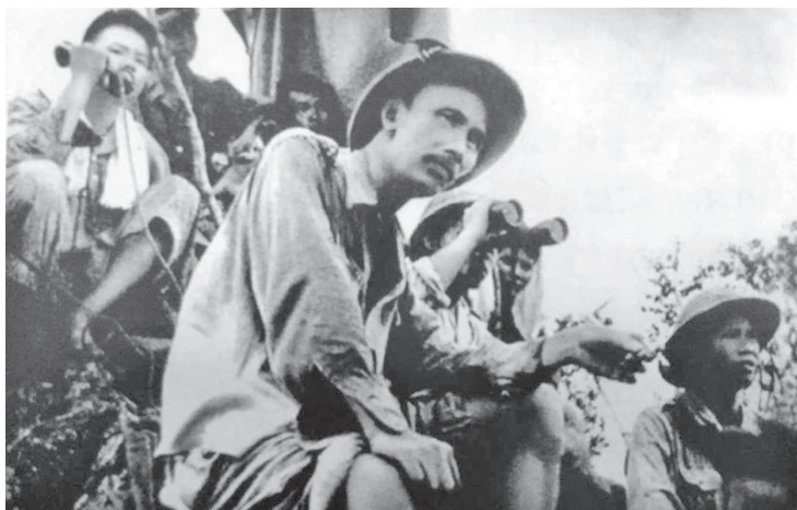
Bác Hồ trên đài chỉ huy trận Đông Khê tháng 9/1950.

địch trên tuyến biên giới Cao Bằng - Lạng Sơn, bắt sống hai chỉ huy của địch tại trận địa (là Le Page và Charton), tiêu diệt nhiều tiểu đoàn tinh nhuệ Âu - Phi của thực dân Pháp.