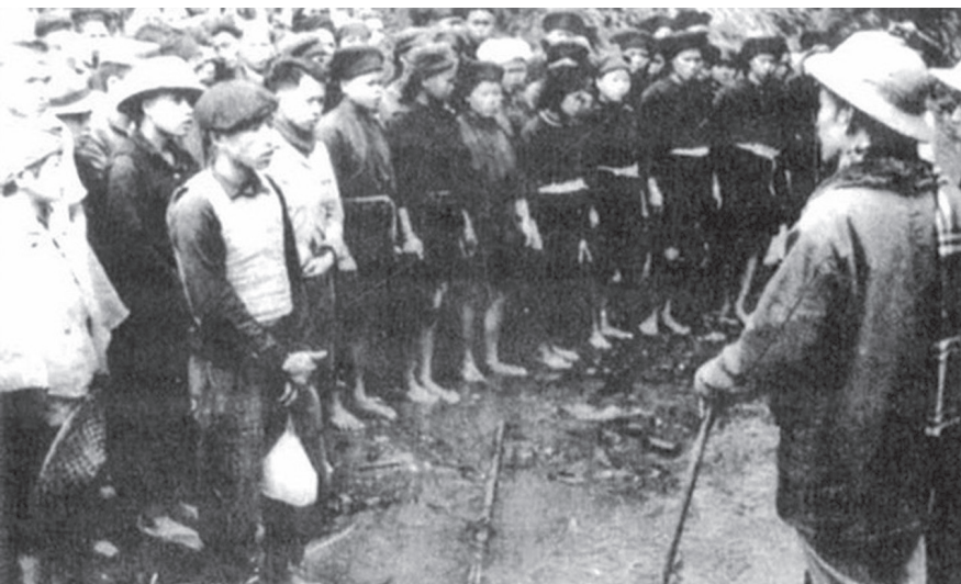
Bác Hồ thăm Đội Thanh niên xung phong công tác Trung ương.

các nhà lãnh đạo cao cấp cùng các cơ quan Trung ương đã sống, làm việc từ tháng 5/1947 đến năm 1954.