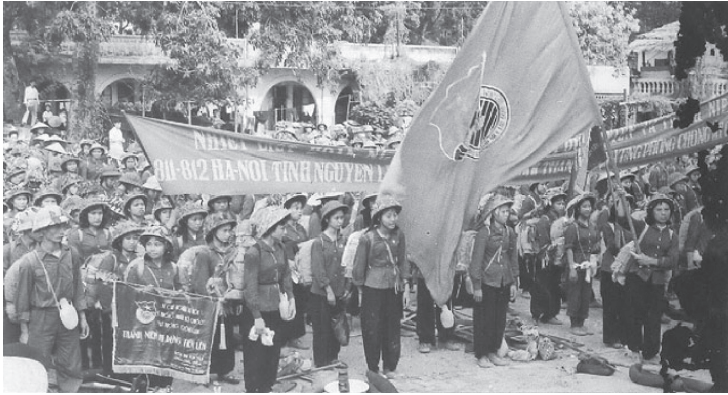
Thanh niên Hà Nội gia nhập Thanh niên xung phong. Ảnh tư liệu.