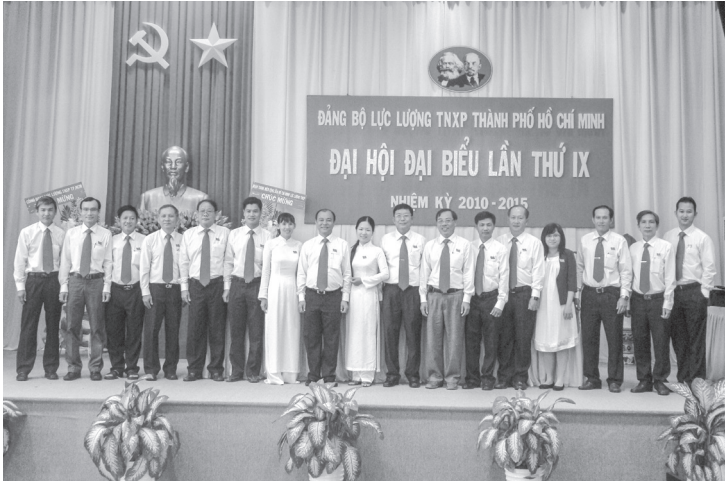
Ban Chấp hành Đảng bộ Lực lượng Thanh niên xung phong Thành phố Hồ Chí Minh lần thứ IX, nhiệm kỳ 2010-2015.

Câu 86: Đại hội đại biểu Đảng bộ Lực lượng Thanh niên xung phong lần thứ XI (2020-2025) xác định mục tiêu tổng quát như thế nào?