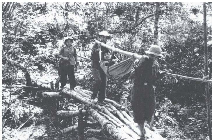
Cánh thương binh về điều trị tại Trạm đường 10 tỉnh Quảng Trị (tháng 3/1970). Ảnh tư liệu.

Đáp: Với những cống hiến xuất sắc trong phục vụ chiến đấu, trực tiếp chiến đấu, lao động, học tập, Lực lượng Thanh niên xung phong Giải phóng miền Nam (tập thể và cá nhân) đã được tặng thưởng 01 Huân chương Thành Đồng hạng Nhất, 03 Huân chương Thành Đồng hạng Ba, 10 Huân chương Quân công hạng Ba, 10 Huân chương Giải phóng hạng Nhất, 50 Huân chương Giải phóng hạng Hai, 117 Huân chương Giải phóng hạng Ba, 26 Huân chương Chiến công giải phóng hạng Ba, 152 Huy chương Giải phóng hạng Nhất, 207 Huy