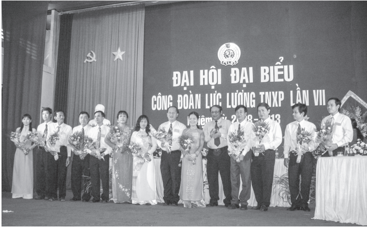
Đại hội Công đoàn Lực lượng Thanh niên xung phong Thành phố Hồ Chí Minh lần VII nhiệm kỳ 2008-2013.