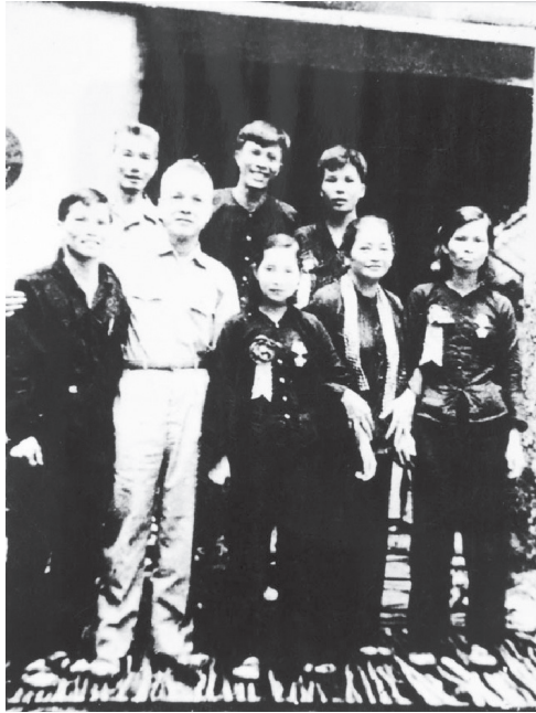
Chủ tịch Nguyễn Hữu Thọ với Thanh niên xung phong Giải phóng miền Nam.