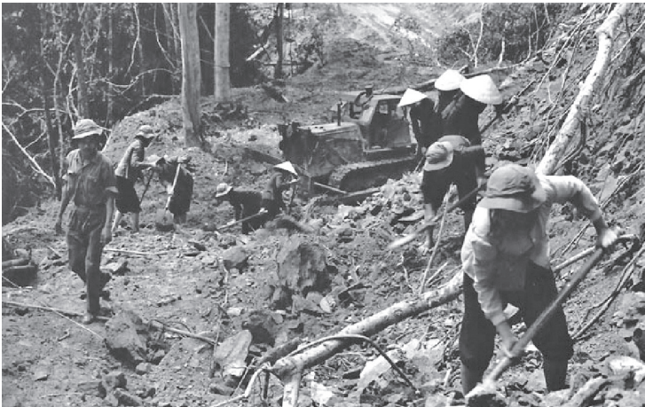
Thanh niên xung phong đang mở đường.