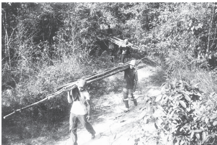
Khai thác vật liệu làm nhà kinh tế mới. Ảnh tư liệu.