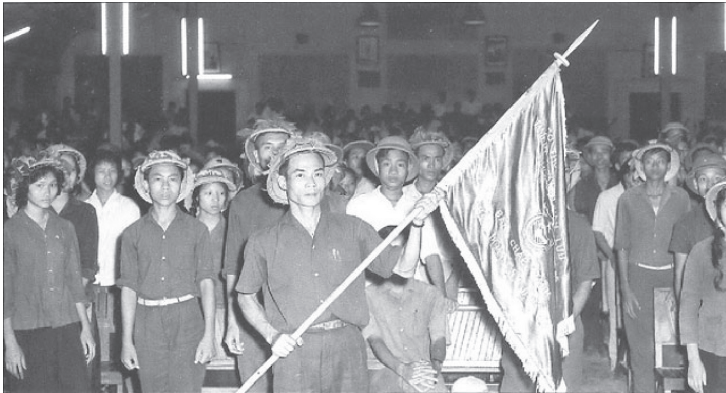
Thanh niên xung phong Hà Nội lên đường gia nhập Thanh niên xung phong. Ảnh tư liệu.

Đáp: Ngày 5/8/1964, đế quốc Mỹ bắt đầu cuộc chiến tranh phá hoại miền Bắc Việt Nam bằng không quân, hải quân ngày càng ác liệt nhằm phá hoại và làm suy yếu tiềm lực cuộc kháng chiến của nhân dân ta. Vì miền Bắc là hậu phương lớn của chiến trường miền Nam, nên Chính phủ đã chỉ đạo các Bộ Giao thông vận tải, Quốc