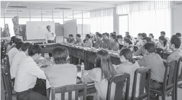
Tập huấn công tác Đoàn Lực lượng Thanh niên xung phong Thành phố Hồ Chí Minh.