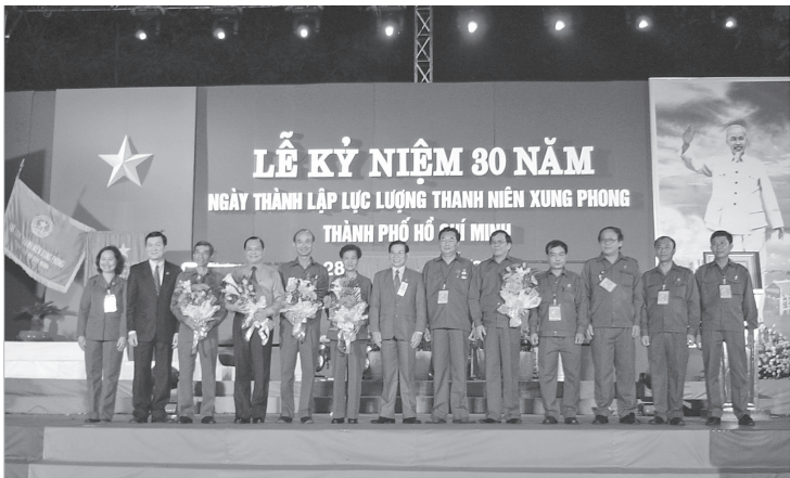
Các đồng chí lãnh đạo Đảng, Nhà nước tặng hoa cho lãnh đạo Lực lượng tại lễ kỷ niệm 30 năm thành lập Lực lượng Thanh niên xung phong Thành phố Hồ Chí Minh.